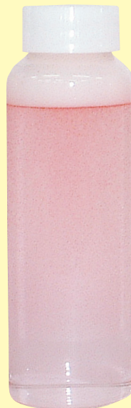
クリアロン ワイドフォーム ハード汚れタイプ