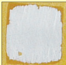
クリアロン ワイドフォーム ハード汚れタイプ