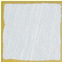
クリアロン ワイドフォーム ハード汚れタイプ