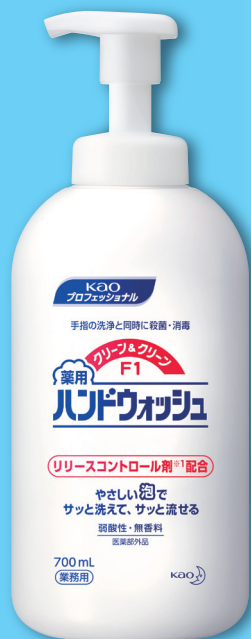
700 mL (フォーマー付)