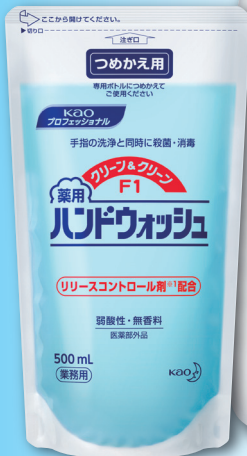
つめかえ 500 mL