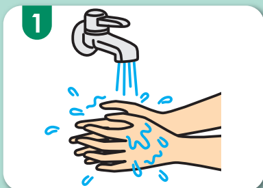
1 流水で十分に両手をぬらします*