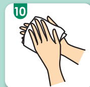
10 ペーパータオルで拭く