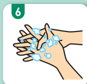
6 指のあいだ、つけねを洗う