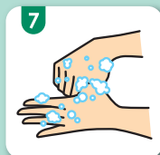
7 親指と手のひらをねじり洗い