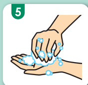
5 指先、爪先の内側を洗う