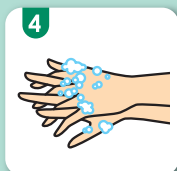
4 手の甲を伸ばすよう洗う