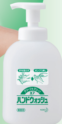
500 mL 専用つめかえ容器