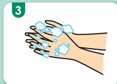
3 両手のひらをこすりながらよく泡立てます