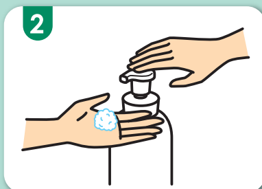
2 ポンプを1回押して泡を手にとります