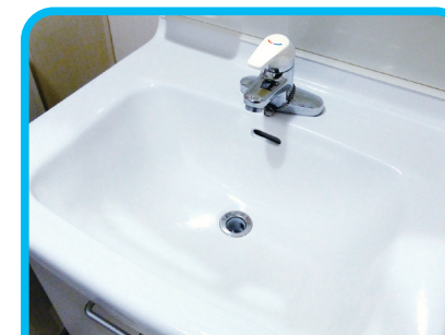
洗面台・浴室の定期的清掃に