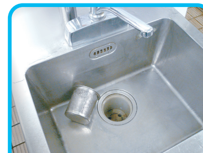
シンク排水口のつまり・ニオイに