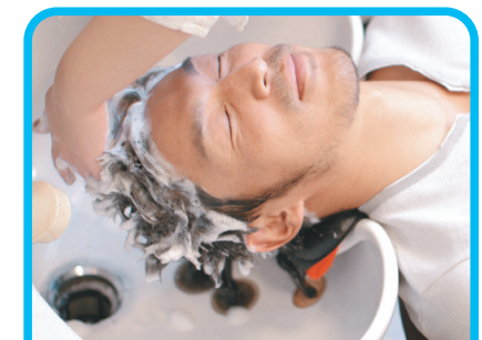
シャンプー台の髪の毛の除去に