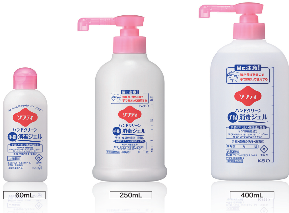
【指定医薬部外品】販売名：ソフティ ハンドクリーンジェル a 有効成分：エタノール 79.7vol%