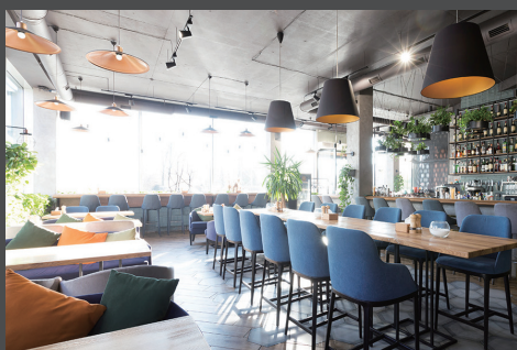
カフェ・レストラン