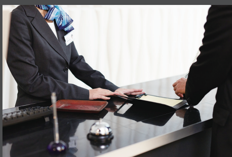
ホテルのロビー・客室