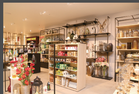
インテリアショップ