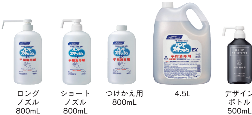
ロング ノズル 800mL